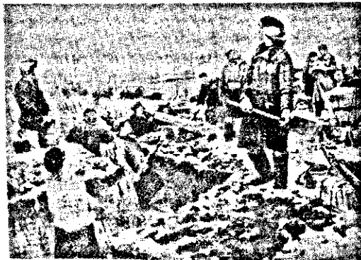
«Կոմերիտականները Մոսկվայի մատոյցներում դիրքեր փորելիս»

Առաջին անգամ Հանքահորում, պատանի մը զարմացած եւ հիացած կը դի-