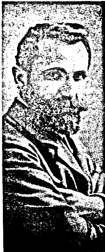
ԼԱԶԱՆ - 1912

Բնորոշ է Քրիստափորի խօսքը: Բնորոշ է նոյնպէս իր՝ հայ յեղափոխութեան վիթխարի տարմին մասին արտասանուած խօսքը: Զուր չէ, որ Մարդակերտ մակդիրը տրուած է անոր: Քրիստափոր մէկ անկիւնէ միայն չէ որ նայէր կեանքին, կեանքի արժէքներէն մեկուն միայն չէ որ կը հաւատար: Բոլոր ուժերուն գիտակցութեամբ կազմուած ամբողջական մարդն էր ան, եւ բոլոր ուժերը լարելու, աննցնելու, համարելու՝ սկզբունքով մը կը մղէր պայքարը: Գծուար չէ շարունակել ու ըսել՝ - Առանց Քրիստափորի ո՛չ միայն Ազատութեան Ճանապարհին չէր գրուներ, այլեւ ազատութեան ճանապարհ չէր ունենար մեր իրականութիւնը, ճանապարհը ուխտեալներու այդ ստուար թիւը չէր ունենար, ուխտեալները այդքան աւարզութիւն չէին ունենար: Քրիստափոր կ'որոնէր, կը մղէր, բաժնիկու օտար: Գրագէտը պարտական ճգնա շունջ էր, պարզ մարդը հերոսութեան առաջնորդող ոգի էր, մտաւորակման չզուտ ու խոնական դարձնող ներկայութիւն էր: Երախտապարտ է իրեն մեր գրականութիւնը, երախտապարտ է՝ մեր յեղափոխութիւնը, երախտապարտ՝ մեր երազարարականութիւնը, երախտապարտ է մամուլանոց իր պատրաստած տաշերուն շնորհիւ բարբարոսներէն փրկուած մեր ափ մը հողը, ամբողջ ազգը: