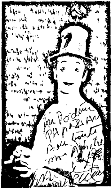
Մով մը զրկել յաջորդ պաշտօնակին, միւս անհանկարծ, միւս պարսքոյն:

Հրացանի՝ թէ ինչպէ՞ս կըցած է զաննի նրբին ան կեցուածքը, շարժումը, որ անմիջապէս կը հասկնան որեւէ ազգի զատկանոց համարանախն, թէ այս բովանակի վանդակի մը մէջ կը ինչպիսի մարդը, հակառակ որ բեմին վրայ ոչ մէկ վանդակ կայ: Կամ կը յազն ան պարսքոյնը անտարբեր, անխիղճ ժամերու մէջ մարդը հասարակութիւն, անհասին համար կարելու կողմ այս կամ ան հարցին, որը պարտաւանդին համար վերածուած է զինն ցանկից սաղարկի մը, որ պէտք է անտարբեր շարժումով մը զրկել յաջորդ պաշտօնակին, միւս անհանկարծ: