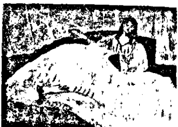
Ժաման Տիւվալ Գործ՝ ՄԱՆԻ

կիներու հետ երկար յարաբերութիւն մշակելէ, երկրորդ օրն իսկ ուզեց Փանն ունենալ իր մօտը: Վարձեց աւելի ընդարձակ տուն մը, դնեց կահ-կարասիներ, զարդեր, նկարներ, արձաններ: Երկու տարիէն հայեցաւ ժառանգութեան կէտը: Պոտլէր ստորադրեց մուրհակներ, որոնք մինչեւ մահ զինքը պիտի հալածէին ուրախաններու պէս: Լուրը կը հասնի մօրը եւ խորթ հօրը: Զօրավար Օփիք, սիկնոյ հաւանութեամբ կ'առնէ կարեւոր որոշումներ, վերջնակէտ մը դնելու համար Շարլի զխտութիւններուն: Կը հաստատուի Դաւաղան խնամակալութիւն մը, որ կը հսկէ մնացած զուժարին վրայ, եւ պաշտօն կը յանձնուի նօտար Անսէյին որոշել ամսավճար մը, որ բաւական ըլլայ ամուրի երիտասարդի մը ապրուստին եւ տան վարձքին: