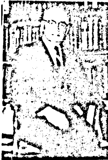
Հրանդ Բ. Արմէնի ցարդ հրատարուած գործերն են.

Օրապահիկս օրէնսդիտութիւն, Հողեպահիկս Հայոց Պատմութիւն: