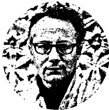
Փ Ի Լ Ե Ր Պ ՈՒ Ի Ժ Ա Ս

Արժույթի, Քառերգի ու Փրանսիսի բուրդը գրողներուն պէս միամտանակ քանի մը Քերթում մէջ յայտնուող ստորագրող Փիլիպ Պուրթուս, Եմիլիո Գրուլանս-ի թիւ 1231 եւ 1236-ին մէջ, երկու գրութիւններ ստորագրեց, որոնք նուազ շահեկան չեն նաեւ մեզի համար ու կ'արժէ որ կարգադրուին բարձրին կողմէ: