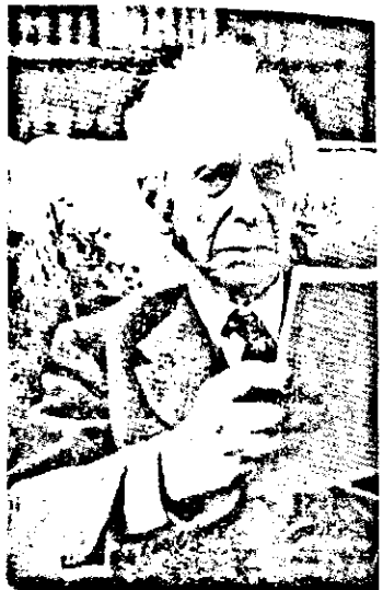
չրջանակի մարդը, ապա յանկարծ յիզ- ւորուած յեղափոխականը:

Իր կեանքը երկու խոշոր Հանգըր- ւաններ ունի՝ սալոններու, ազնուական