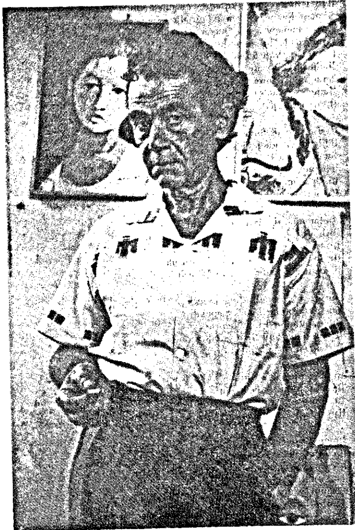
Որբութեան խուլ խորխորատի մէջ դեգերող Սովակունկ մի արձագանգ Հրամայեց կրծել դրանք՝ Ինչպէ՞ս, ինչպէ՞ս