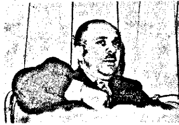
ՏՈՒՌՔ՝ ՍՈՒՆԷՅՍԻ ԸՏՐԻՍՍ՝— «Այդ պահում ես այ ցածր գահ-մատուրականն էի...»

նութիւնը, եթէ ոչ մարդուն մէջ պայ- քարկու, անկէ կացութիւններէն դուրս գալու եւ, մանաւանդ, «ամկատար տեմ- շեր»ու իրադարձման ի խնդիր անոր նե- րաշխարհին մէջ մարդկային արժէքնե- րուն եւ կարողութիւններուն ճանաչման ու բիրեղացման: