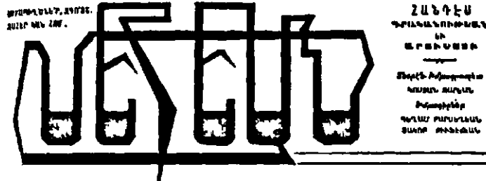
M E H Y A B, Revue arménienne de Littérature et d'Art