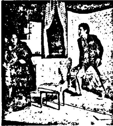
Ալլըքսթի (Սիլվա Պարուսեան) եւ Ալլըքսթի (Վիգէմ Գարրինեան)

Եւր բնժի զանազան անկիւններուն վրայ: Ժը կար ծանաւորարար տիկ. Սթոքսի, Ալլըքսթի ժոր պարագային (Մարի-Ֆոզ Մանուկեան): Այդ քան պոռայցոյ, Ղլային, ու իրապէս բնութեամբ տիրապետող ժոր ժը տիպարին զիմաց Ալլըքսթի ընկզկաւը, ծամացոյցով ժորը ղիւտան զարնելը չի կրնար ուրիշ եւ խորունկ իմաստ ժը ստանալ, կը զանեայ պարզապէս Ղլայնութեան ետեւորար- ձութիւն ժը: Մինչ նիւթը այդ չի, այդ չի խոր- հուրը, Ընդհանկուտակն, շատ աննշարտ, շատ բար- ըի ու ձեզմ ձեւով վարուող, զուրպուրացող ժոր ժը զուրպուրանքին ծակկզրոն անդամանքն է, որ կացութիւնը կը գարննէ ողորդական, եւ թի- բուս ժորը նմանցնելու՝ Լամար էր, որ աղկան տիպարին ձէջ եւս եոյն ձեւի պոռայցոյ Ղլայնու- թիւն ժացուած էր. Քի Նրկու պարագաներուն ալ տակնորդ: