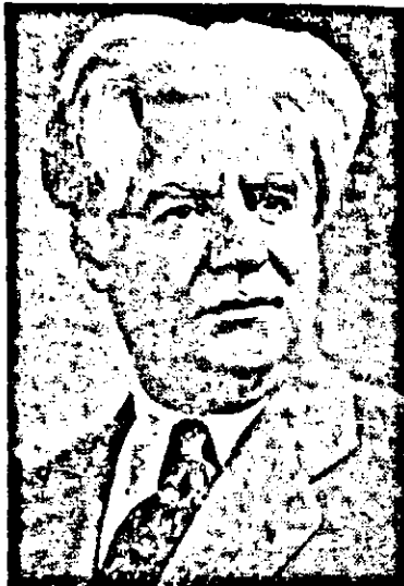
«Գրական քերք»ի խմբագրական կո- լեգիան թերթի 1973 թուականի մրցանակ շնորհեց:

Նոյն հետաքրքրութեամբ եւ ընթերցողին շահագրգռութեան եւ խորհրդանշանեան սակի մը ընծայելու համար՝ կը ներկայացնենք նաեւ պը- սակուած այս գործերը, ներկայ թիւով՝ Գեղամ Մարեանի բանաստեղծութիւններուն շարքը, Թա- ֆաշի Արամեանի գրաժողովին յաջորդ թիւով: