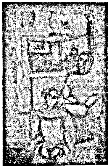
«Արուեստագէտի մը աշխատանքը»

«Երիտասարդի մը մահը ճաւաքելութեան կը նմանի» — ըսած է մտածող մը: Համեմատութեան ի՞նչ եզրով պիտի խորաչափէր արդեօք ան արուեստագէտ երիտասարդի մը մահը, որ իր խորտակած հողեղէն անօթին հետ կը խամբեցնէ նաև աշխարհը առանձնայատուկ ստեղծագոր-