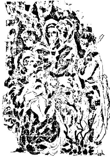
ԵՂՆԻՒՐԸ և ԵՂՈՒԻՒԸ, կամ՝ Փոյգորային Վիպապաշտո քիւն:

(Եւսփոր), այլ գործի մը մէջ՝ կուժը կրօրէն բռնած գեղջուկի մը, երեք պատանիներու և գրկուած զանուկին հետ (Ելստազանանէն), ապա՝ նոյն ժանկամարդուհիները, միեւնոյն ժանուկները և կենդանական աշխարհի ներկայացուցիչ զանկերուն տեղ պատգործուած միջի (Եվերադարձ), իսկ բախտաւոր պարագային՝ լապտերը մէտին, իր պատանի խաղակիցներուն հետ Էմարաուիիւնը որանոջ պատանին, քրնրւած՝ Քախիժէն Քոչչոյան մարմիններու մեղի մզուածութեան և փնտառուքի սեմին բողբոջոյ յուսատու լոյսին հակադիր միջնորտին մէջ (Էմանրան):