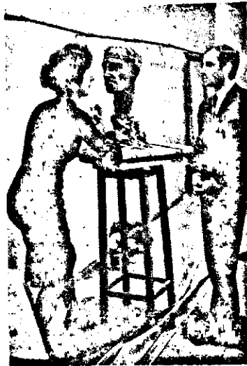
ՀԱՅՐԵՆԻ ԵՐԻՏԱՍԱՐԻ ՔԱՆԴԱԿԱՆՈՐԾՈՒՄԻ ԱՐՈՒ ՄԻԼԻՔԵԱՆԻ ԱՇԽԱՏԱՆՈՑԻՆ ՄԻՋ.