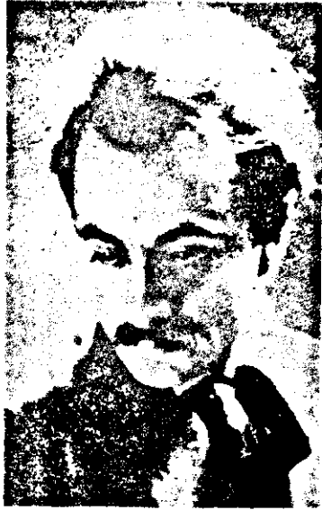
Յննդկան 100ամեակը ծանուցող յայտագրի նախա- բան:

Հասարակական, շահագործումներու եւ խաւարամտութեան դէմ ծառայած լիբանանցի ըմ- բաս ժողովուրդը յորհրդանիշի վերածուած փայլած նախնի փայլանի Յննդկան 100ամեակը պետական լափանիշով նշելու իր որոշումով՝ գտնիքը կու զար ընդգծելու, որ վճռած է շտապոյնս արեւ- ջրեկէ զբաղակրթական այս պատասխանաւոր- ութիւնը: Այդ իսկ պատճառով, նախագահ Ժե- մաշէլ որոշած է անձամբ զլիբանանցի յորհրդան- կան զեղադոյն ժամերը, որ 100ամեակին աւի- թով կը նախատեսէ իրականացնել հաւաքներ, հրատարակութիւններ, ցուցահանդէսներ, թա- սերական — պատկերասփիւռային ելոյթներ եւ այլ ձեռնարկներ: