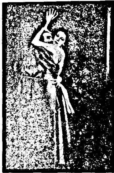
«Մոռացնայ հերոսարտին» քասնքախազիմ մէջ, Գլխննդինի դերով

զրեթէ նոր հնարքներ եւ Փարսանովի «Նոսն զոյնը» բեմադրին բարերար ազդեցութեան տակ, հանրութեան ներկայացուց խորաթափանց եւ կուռ բեմադրութիւն մը, որուն ընթացքին տեղի ունեցած զէպքերու եւ հոգեվիճակներու թաւալումին լարուած ուշադրութեամբ կը հետեւի հանդիսատեսը: Օչտագործուած խորհրդանշանները բազմազան են, պատճառաբանուած ու թելադրական: