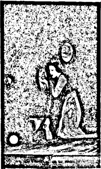
... եւ «Համէթ»ի մէջ, Կերթրիտի դերով

Տարբեր խառնուածքի տէր մարդիկ, որոնք բուրն ալ անդամ էին Դիմադրութեան տարիներուն հակադիմադրական ընդլայտակեայ բլիթի մը, այժմ կանչուած են այն թաքստոցը, ուր քան տարի առաջ անակնկալօրէն խուզարկուած էր ու ձերբակալուած եւ անհետացուած էր բլիթին պետը, նոյնինքն Մարի Օքթոպրի ամուսինը: Երբ կը յայտարարուի, թէ իրենցմէ մէկը մասնած է բլիթին պետը, իրարու հանդէպ եղած վստահութիւնն ու սիրալիր վերաբերումը յանկարծ տարրեր դոյներ կը ստանան եւ կը սկսի հարցաքննութիւններու շարք մը, Երեւան բերելու համար դաւանանք: Կը ստեղծուի անել ու հոգեխառով կացութիւն մը: Դիմադրութեան արամադրութիւններով եղբայրացած տիպարները հետզհետէ կը թշնամանան իրարու հետ ու, հակասական փաստարկներու առկայութեան պատճառով՝ կասկածը փոխ առ փոխ կը կեղրոնանայ ամէնուն ալ վրայ: Անվստահութիւն, հրատժափութիւն, անարգանք եւ ցատում իրարու կը յաջորդեն: Ամէնէն աւելի տառապողն ու ճշմարտութիւնը հետապնդողը Մարի Օքթոպրն է, որ նոյն