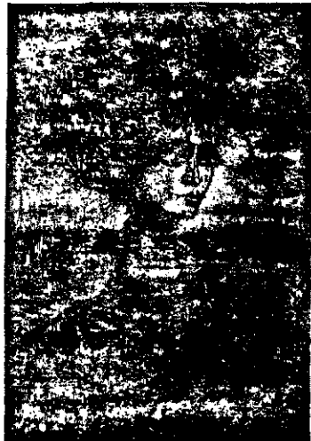
Գաղզուի «Կնոջ դիմանկարը»

Ֆրանսուայ անուանի գեղանկարիչ ժան Գաուզու (Գաուդի Զուլուեան) Մոսկուայի մէջ վերջերս տուած է ցուցանահէս մը, ուր ներկայացուցած է 100է աւելի աշխատանքներ: