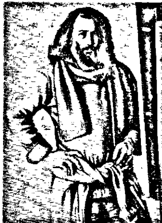
Ռ. Խաչատրեանի մէկ ինքնանկարը

Յորհրդ. Հայաստանի ժողովրդական նկարչի կողմին արժանացած զեղանկարիչ Ռուզուի Յաչատրեան, որ խորհրդանայ զեղանկարչութեան տիրական զգեցերէն մէկն է, մեծ համբաւ նուաճած է այս ասորի, երբ անգլի ունեցած են անոր անհատական ցուցանանքները՝ Երևանի և Մոսկուայի մէջ: Այս զոյք ցուցանանքներուն, Հայրենի արուեստագէտը ներկայացուցած է ըստարտաբուղիի վրայ նկարած իր գործերը (զիմանկարներ և այլ նկարաշարեր), որոնք Հանդիսանեաներուն ուշադրութիւնը զրուած են իրենց զուտական յիզուածութեամբ և կատարելագործուած խորութեամբ: