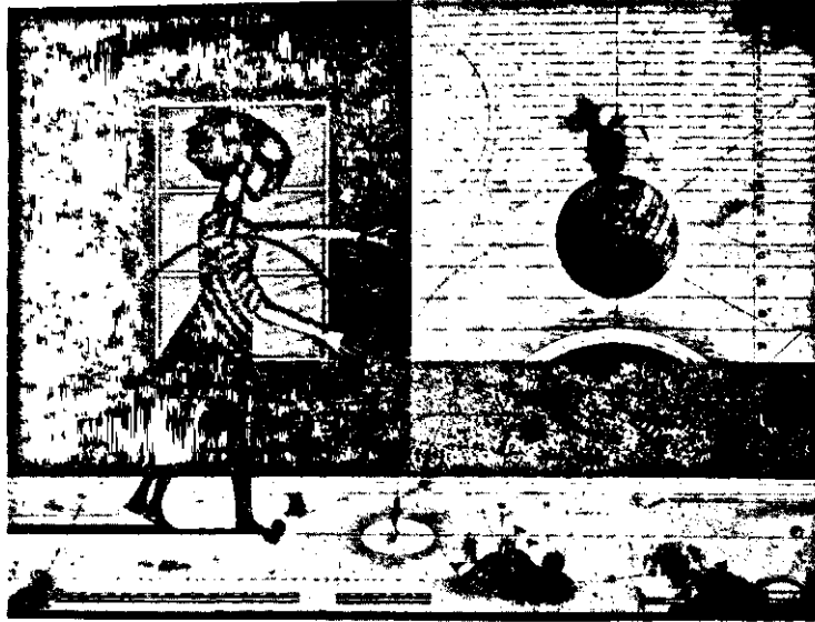
«Խաղեր», Eau-forte acquatinte, 1981

Նախապես և Ժամանակին առկայ՝ գեղարվեստական չափանիշներու: Իրրեւականութեամբ և վկան վաթսուսական թըւականներու կացութեան, Ասատուր փախած և ընտրած է ըլլալ նկարիչը քառասուն վիճակներու, անյաղթաբարելի մղձաւանջներու և մտայլ երդիծանքի: