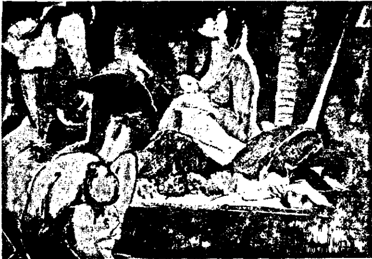
«Կնանկի շրջանը», Իլգաներգ, 1955

Լիբանանահայ, նաև լիբանանեան նկարչութեան մէջ հիւսմանիտական հակումները իրենց լաւագոյն արտայայտութիւնը գտած են Կիրակոսեանի արուեստին մէջ: Անոր շուրջ երեսունըչինգ տարիներու վաստակը հիւսուած է մարդկային ջերմութեան, մտերմութեան, պարզամտ բողբոջի եւ կարգ մը ընդհանուր դաշտափարներու վրայ հիմնուած կեանքի պահպանողական մը շուրջ: 1926ին Երուսաղէմ ծնած Կիրակոսեանին համար (ծագումով՝ կիսով ասորի) ընկերային եւ անհատական անկախուն գոյութիւնը, իբրև Խաղաղի հետեւանքը Եղեռնին, բնորոշած է իր միջափայլը: Կիրակոսեան ապրած է դասնութիւնները իբրև մանուկ եւ պատանի. երիտասարդութեան առաջին ասորիներէն իսկ, իր ամբողջ գործունէութիւնը կեդրոնացուցած է հասկնալու եւ ներկայացնելու լիբանանահայկական իրականութիւնը՝ մարդկային հեռաւորութիւններուն մէջ: 1950էն 1960 երկարող պարօն համալսեանի կոչուած տասնամ-