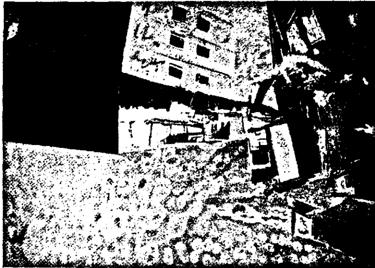
«Տօնակամ օրեր», Իզմաների, 1981