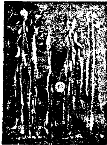
«Վերածնունդ», Եւզաներկ, 1967

Իր աշխարհաւայեացքը եւ անձնական «ընտանցութիւնը» խտացնող եւ փոխաբերարար ներկայացնող «վիճակը» «ընդունվեալ տեսողութիւնն» է (vision sous-marine, իր արտայայտութեամբ): Զուրբ հողին է, ժայռը՝ նիւթը. երկու տարրերուն միջև յուերժականօրէն առկայ բախումը, տեսակ մը տիեզերական մակարդակի վրայ՝ «գոյաբանական փոթորիկ» է, որուն արտայայտութիւնն է իր արուեստը: Մահուան անդամալուծող սարսափը, ֆիզիքական բրտութիւնը, արտայայտուած՝ Ջարդին, շիրտշիմայի եւ ընդհանուր սոմամբ մարդու առօրեային մէջ, հախառահմանուած առաւապանքը՝ սկսած Աշամ եւ Եւայի պատմութեամբ, ապա՝ կոթողոյնացած Քրիստոսի խաչելութեամբ եւ, մերթապէս, յաղթահարուած Յարութեամբ, այս բոլորը կը նշեն հանդրուանները հողին պայքարին. մարդը, աւելի