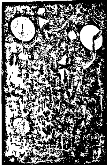
«Վերածնունդ», չեխական մեյան, 1967

ճիշդ՝ մարմին հաղած այս հողին, Կիւվի կարծիքով՝ իր կրաւորականութեամբ է, որ կը դիմադրէ արտաքին աշխարհէն հասած հարուածներուն, իր լուսութեամբ արհամարհելով նիւթական կորուստը, որ յուշետե կը հաստատյ վախճանին՝ անմահութեան: