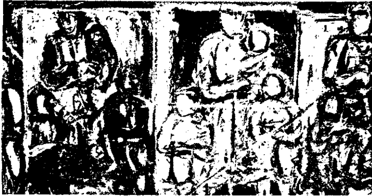
Վնասկական (Քրիսթիէ), Բաշաևերկ, 1873

ամէն բան: Ան կը նետուի դէպի արտաքին աշխարհը. լեցուն է իր աշխարհը. կ'ուզէ, որ այդպէս ալ ըլլայ իր գործը. կ'ատէ սրարագութիւնները, կարծէք վախճանով ոչնչացումէ կամ մահէ: Արտորանք մը, անհամբերութիւն մը կայ իր մէջ, որ հետըզհետէ կ'աւելնայ: Այս տրամադրութիւնը ծագում կ'առնէ անցնող ժամանակը կանոններու ձգտումէ մը. Կիւմիտէր կ'ատէ ժխտականութիւնը, իր բոլոր դրսեւորումներուն մէջ: Իրեն կը պակսի ներքին հաստատարականութեան տարրը, աչքին, տրամաբանութեան եւ զգացումներուն միջեւ ներդաշնակութիւնը: Աշխատանքի իր թափին մէջ, ան առիթը չի տար ինքն-իրեն՝ զարգացնելու այդ տարրը, բան մը, որ անհրաժեշտ է որեւէ գործի աւարտունակութեան համար: