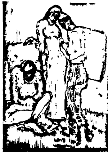
«Փորձագուրկ բռնակիրք» (Ի. Դանկար, 1955)

ներս՝ վան կոկեան շունչ մը և փրձուհարու ածներու որոշ ազդեցութիւն մը պիտի նկատուէ: