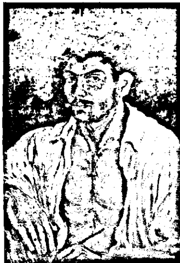
«Ինքնանկար» (ի դեկտեմբեր, 1948)

Լեզուի կարեւոր ջէ: ԱՐՏԱՅԱՅՏՉԱՊԱՇՏ ԵՂԱԾ ԵՍ, ՏՊԱԻՈՐԱՊԱՇՏ, Թէ ՎԵՐԱՑԱՊԱՇՏ՝ ԱՅԳԻՔԱՆ ԱԼ ՄԵԾ ՆՇԱՆԱԿՈՒԹԻՒՆ ՉԻ ՆԵՐԿԱՅԱՑՆԵՐ: ԿԱՐԵՒՈՐԸ ԽՕՍԳԻ Է, ԻՆՉ Կ'ԸՍԵՄՆ Է, ԻՍԿ ԼԵԶՈՒՆ ԻՆՔՆԱԲԵՐԱԲԱՐ ԿԸ ԲԵԻ ԽՕՍԳԷՆ, ԻՆՉԷՆ, ԵԹԷ ԻՍԿԱՊԷՍ ԸՍԵԼԻՔ ՈՒՆԻՍ, ՄԱՐԴԿԱՅԻՆ ԽՈՐ ՏԱԳՆԱՊ ՄԸ ՈՒՆԻՍ: