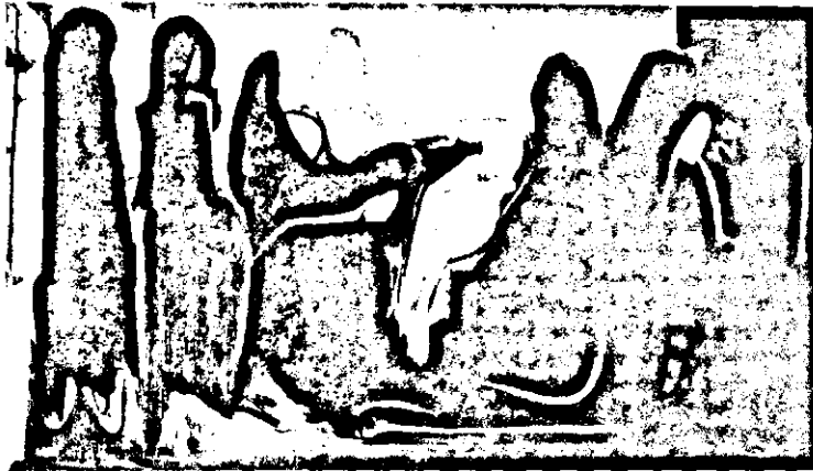
«Պատշգամի վրայ» (Ի. Գանկար, 1965)

էութեան վրայ եւ գայն բարգմանեցիք վրձինի քանի մը արագ եարուածնե-րով: Եթէ զանակով կամ ճոյնիսկ վրձի-նով զծուած յիսունական բաւականե-րու ձեռ գործերը բազդատենք վերջին տասնամեակի պատճառներուն հետ, առաջին իսկ ակնարկով եր նկատենք, որ կարծր անշարժութենէն դուր հասաք սանձարձակ արագութեան, փլատիք յարաշարժութեան մը, որ ձեռով մը քստորոնի բեւեր կը յիշեցնէ: Ճի՞շդ է: