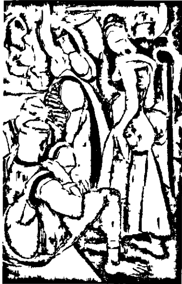
«Նուկան» (Գրանկար, 1951)

սկսայ շափերը, Համեմատութիւնները ամենայն ճշգրտութեամբ եւ արագու- թեամբ վերարտադրել, եւ ձեռքս այդ եղաւ, ձեռքս հոգի եղաւ, ձեռքս միտք եղաւ, ձեռքս արտայայտութիւն եղաւ, մէկ խօսքով՝ ձեռքս մտտէլ եղաւ, թուղթ եղաւ, մատիտ եղաւ: