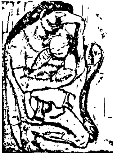
«Կիճը և մանուկը» (Ի. Դանկար, 1955)