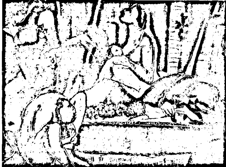
«Կեանքի շրջանը» (Իզահար, 1955)