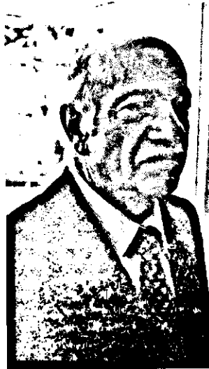
Երևոյ, որ հայ եւ արաբ տեղացի հասարակութեան ներկայացաւ զեզարուեստական ձեռնարկներով, ներկայիս կը հաշուէ աւելի քան 50 անգամ: