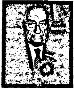
որուն տարեկան եկամուտով շարունակարար գիրքեր պիտի հրատարակուին եւ մշակութային ծառայութիւններ ձառուցուին մեր ազգին:

1993ի Մայիսին, Գարեգին Բ. Կաթողիկոս հայրապետական յատուկ կոնգրակով մը Ա. Չագրճեանի շնորհած էր Կիլիկեան Իշխանի շքանշան: Վեհափառ Ռայրապետը, բարձր գնահատել էտք մեծ բարերարին ահմճ ու գործը, իր կոնգրակը օրին կ'եզրափակէր Ռուտենայ տունըով: «Մեծի Տանն Կիլիկիոյ Հրատարակչական գործին ան բերաւ իր յայտարար օժանդակութիւնը ոչ միայն Յակոբ Օշականի կոթողական գործերու հրատարակութեան մեկնատութեամբ, այլև հաստատումովը ԱՒԵՏԻՍ ԶԱԳՐՃԵԱՆ ՀՐԱՏԱՐԱԿՉԱԿԱՆ ՄՇԱԿՈՒԹԱՅԻՆ ՖՈՆԴՏԻՆ: