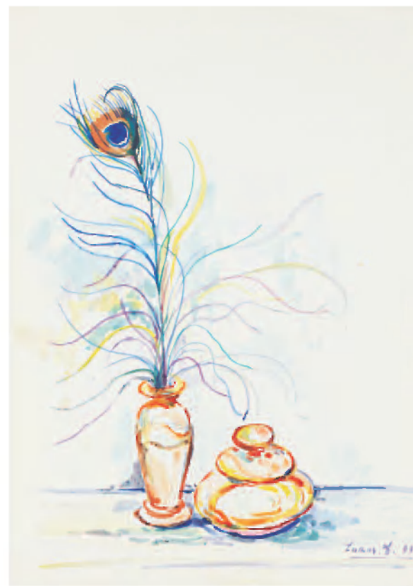
«Փոխան ծաղիկի», ջրաներկ