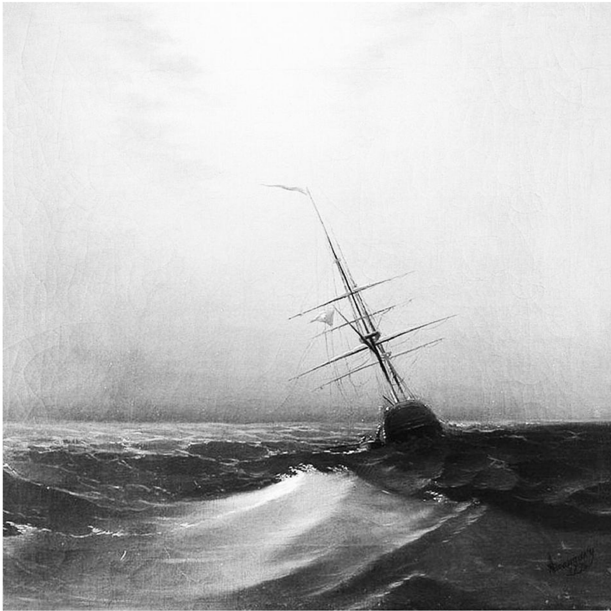
Գիշերը կապոյտ ալիք, 1876, Յովհաննես Այվազովսկի