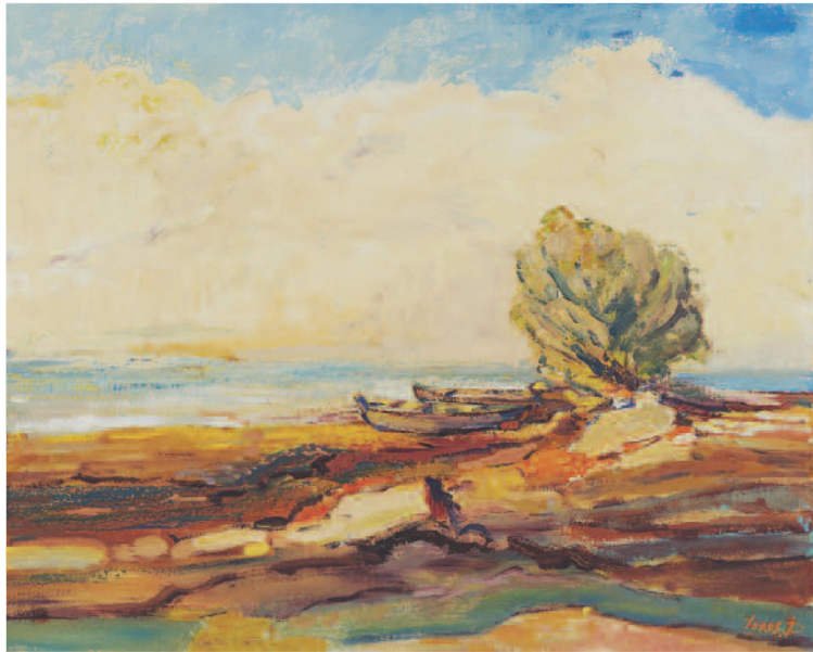
«Մենատր նաւը», իղաներկ

ծռած ծառ մը առուակի մը եզրին, չորցած տատասկ մը տարածութեան վրայ, անմարդ աբնակ խրճիթ մը պուրակի մը մէջ, միայնակ փետուր մը ծաղկամանով, լքուած նաւակ մը ծովափին եւ