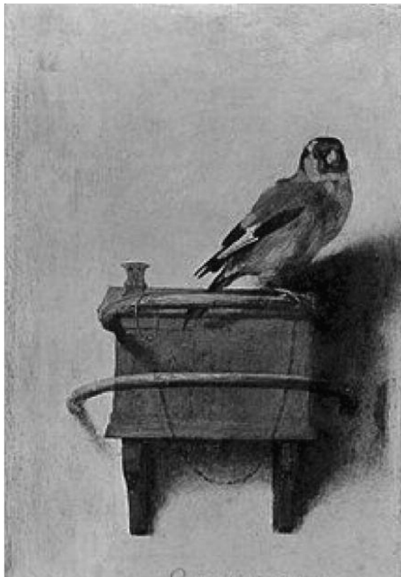
The goldfinch, ԵԿՔԱՆԻԿԸ, 1654, Ֆապրիսիոս

Տոնա Թարթ, 800 էջ, Հատուած** (Վեպը գրուած է առաջին դէմքով, եւ Թեոն է խօսողը)