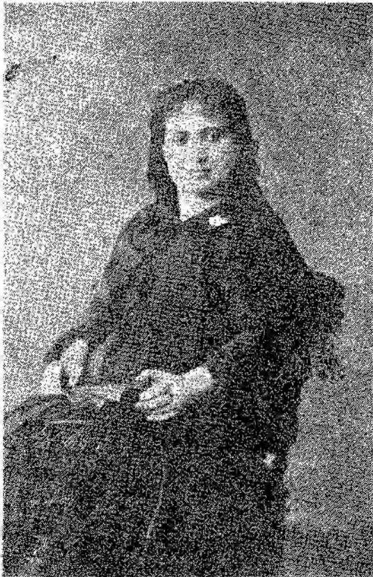
Նենք թէ՛ այդ բանաստեղծութիւնը եւ թէ՛ անոր մասին տուած Օշականի վկայութիւնը: