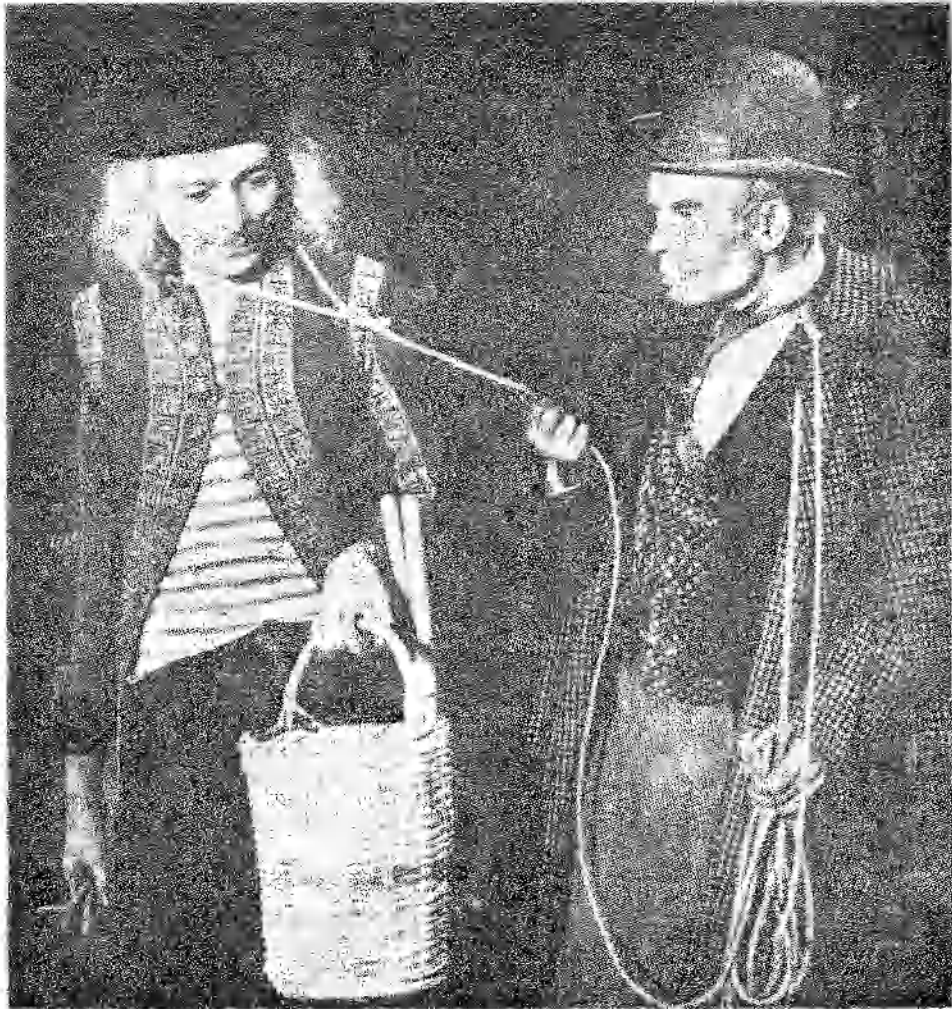
ԼԱՔԻ ԵՒ ՓՈԶԶՈ

ՓՈԶԶՈ . — Հո՞ս, ի՞մ հողերուս վրայ : ՎԼԱՏԻՄԻՐ . — Գէշ մաքուլ չէինք մօտե- նար :